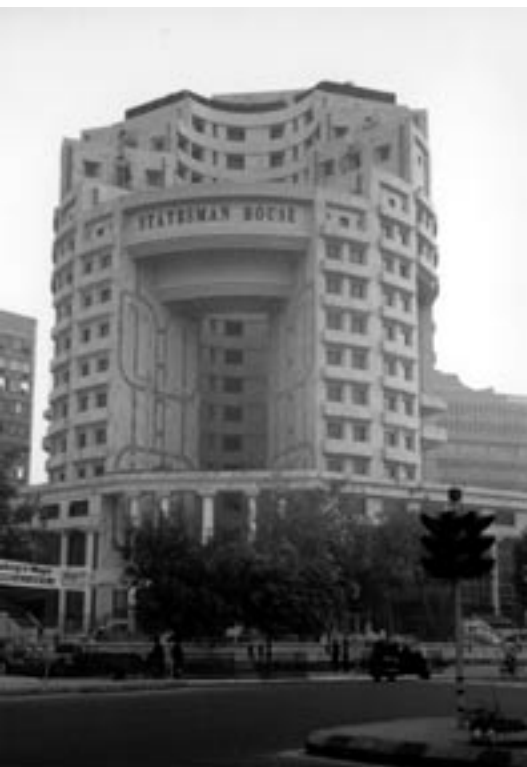
Abb. 6: Zeitgenössische Hochhausarchitektur in der indischen Hauptstadt. New Delhi, Indien

Indien, mit seinem Zeitbegriff, der dem oben beschriebenen Verständnis recht nahe ist, zeigt diesen Umgang mit architektonischen Elementen aus verschiedenen geschichtlichen Momenten. Die nach unserem bisherigen Verständnis von Zeit widersprüchlich erscheinende Architektur des heutigen Indiens (Abb.6) zeigt in der Tat eine mögliche Deutung und Umsetzung einzelner Aspekte dessen, was im obigen aus der amerikanischen avantgardistischen Architekturdiskussion abgeleitet wird, jedoch in Amerika selbst bisher zu wenig brauchbaren Architekturen führte. Das Phänomen des amerikanischen Einfamilienhauses aus dem „Katalog der Geschichte“ hingegen erscheint nicht mehr als schlichte „Unbildung“ und „Unterentwicklung“ gewisser Bevölkerungsteile, sondern wird unbewusste Manifestation eines aus der avantgardistischen Diskussion abgeleiteten neuen Verständnisses von Zeit, nämlich dem der Verfügbarkeit vergangener Epochen als Reservoir gegenwärtiger Architektur. Es sei hier klar erwähnt, daß weder die indische Gegenwartsarchitektur, noch das amerikanische Kataloghaus die schlussendliche Antwort auf in der amerikanischen Architekturdiskussion thematisierte Fragen darstellt, vielmehr geht es um die Art ihres Umgangs mit Zeit, Geschichte und Kultur.