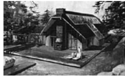
Style: „Recreation/ Vacation“

Unser Verständnis von „Zeit“, der damit verbundene Umgang mit geschichtlicher Architektur, und ihr Zusammenhang mit den Gedanken der oben angesprochenen amerikanischen Diskussion soll im folgenden Anlass zur Formulierung einiger Gedanken sein.