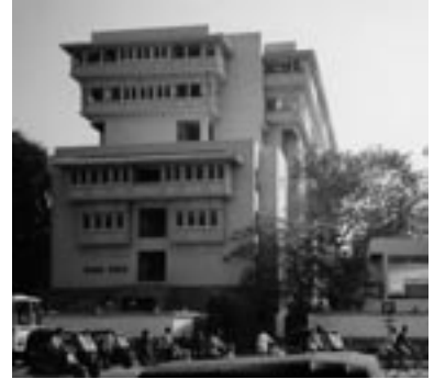
Abb. 5: Zeitgenössische indische Architektur in Ahmedabad, Indien

Die Überwindung der traditionellen westlichen Vorstellung einer zielgerichteten Entwicklung der Welt, führt zur Überwindung unseres heutigen Verhältnisses zu vergangenen geschichtlichen Momenten und ihren Phänomenen. Die Vorstellung eines rhizomartigen 1 Raum- Zeit- Kontinuums, in welchem verschiedene Elemente unterschiedlich gerichtet und über scheinbar feste Kategorien hinaus interagieren können, führt zur theoretisch legitimierten Möglichkeit der direkten Anknüpfung an Vergangenes.