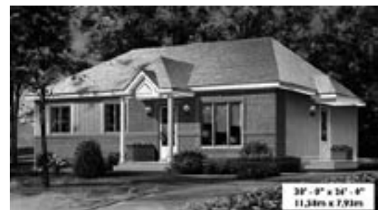
Abb. 2a+b: „HOMEPLANS“ - Kataloghäuser: Alle architektonischen Pläne und Details können beim Vertreter für ca. 900 US $ bestellt werden. Die Ausführung erfolgt durch lokale Handwerker.