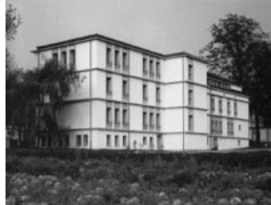
Abb. 8: Bildungszentrum La Longeraie, Morges, Miroslav Sik, 1996. Publiziert in „Altneu“, Miroslav Sik, Heinz Wirz, Quart Verlag, 2000

Auch in diesem Fall betonend, dass z.B. Hans Kollhoffs Hochhausvisionen für Berlin (Abb.7) und Frankfurt, oder auch Miroslav Siks Mischungen historischer Typologien mit dem Heute (Abb. 8), keinesfalls als der Weisheit letzter Schluss erachtet werden sollen, und wissend dass die Argumentation ihrer Architekten keinerlei Bezüge zu oben angestellten Folgerungen aufweist, geht es hier um ihren Umgang mit Zeit, Kultur und der Rolle des Menschen, und dem Potential eines aufgeklärten, im Obigen theoretisch neu fundierten Wiederbelebens einst bereits geschaffener architektonischer Qualitäten. Eine neue Denkweise, die man als „aufgeklärten architektonischen Anthropozentrismus“ bezeichnen könnte, und die die Errungenschaften vergangener Epochen als für die Gegenwart verfügbar betrachtet, indem sie sich von einem traditionell geprägten Bild von kultureller zeitlicher Abfolge mit unwiderrufflich abgeschlossenen Zeitsequenzen trennt.