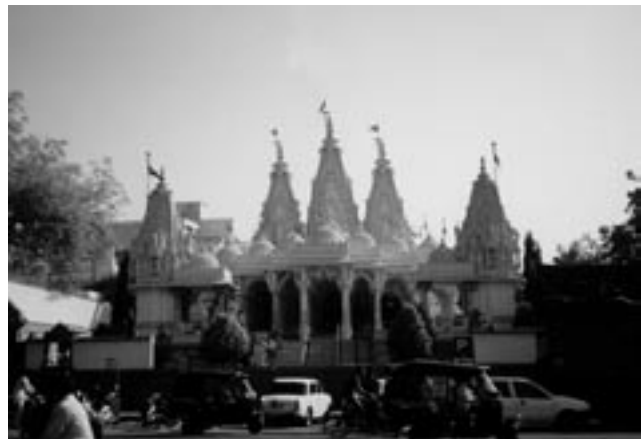
Abb. 4: zeitgenössische hinduistische Tempelanlage, Ahmedabad, Indien