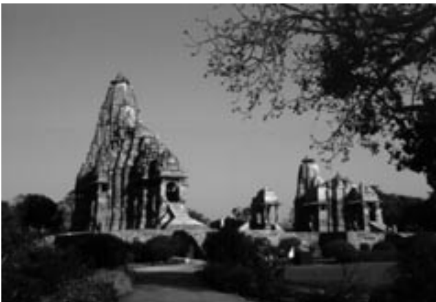
Abb. 3: Hinduistische Tempelanlage des 1. Jahrtausends n. Chr., Khajuraho, Indien