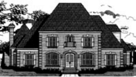
Abb. 2c- g: „www.HOMEPLANS.com“ Style: „French Chateau“