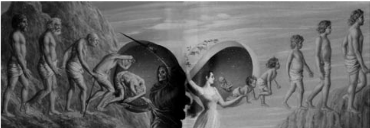
Der unendliche Zyklus der Wiedergeburt , Gemälde (Ausschnitt) von Bharadvaja Dasa, Indien

In diesem Zusammenhang ist auch der indische Umgang mit Architektur zu verstehen. Ohne ein bewusst forciertes Verständnis von sequentierter Entwicklung und einer konkreten „Verantwortung gegenüber dem Zeitgeist“ werden Tempelanlagen in altem Stil (Abb. 3) erbaut, und nach belieben mit modernen Adaptionen (Abb. 4) versehen. Umgekehrt werden im Wohnhausbau, in dem heute die Betonkonstruktion des Domino- Systems (Le Corbusier) vorherrscht, frei nach Geschmack Elemente und Symbole traditioneller oder gar kultur-fremder Herkunft verarbeitet (Abb. 5, 6). Eine Architektur die sich nicht im Kontext einer kulturellen teleologischen Entwicklung, sondern lediglich einer Veränderung sieht, begreift die architektonischen Elemente anderer geschichtlicher Momente als zur Verfügung stehendes Reservoir, um die im Jetzt gewünschten Wirkungen zu erzielen. Auch im indischen Film führt die selbe