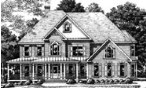
Style: „Grand Manor“