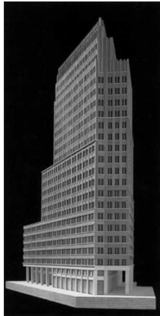
Abb. 7: Modellfoto des ausgeführten Hochhauses am Potsdamerplatz, Berlin, von Hans Kollhoff, 1999